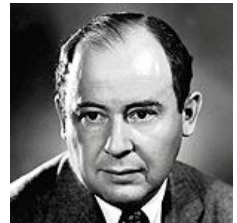
John Von Neumann

1969 - Kenneth Thompson y Dennis Ritchie, de Bell Labs, desarrollaron el sistema operativo Unix .