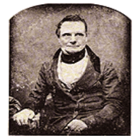
Gottfried Wilhelm Leibniz

1671 - El filósofo y matemático alemán Gottfried Leibniz desarrolló una máquina multiplicadora.